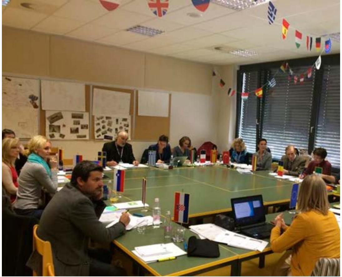
Slovenya'da yapılan proje toplantısından bir kare.

öğrencilerin meslek alanında ihtiyaç duydukları yabancı dil eksikliklerini gidermelerine büyük katkı sağlayacaktır. Öğrenciler bu programı cep telefonlarına da yükleyerek mesleki literatüre rahatlıkla ulaşabilecek, pratik yaparak bu dilleri öğrenebilecek ve gerekli bilgilere çok kısa zamanda ulaşabileceklerdir. Turizm sektörünün en büyük sorunlarından biri olan yabancı dil konuşabilen çalışan sorununa biraz da olsa çözüm getirmeyi amaçlayan bu programın ileriki zamanlarda daha fazla kişi tarafından kullanılması amaçlanmaktadır. Mayıs 2018 de yapılacak olan toplantıyla program, ilimizde turizm sektöründe faaliyet gösteren kuruluşlara, yabancı dil öğretmenlerine ve öğrencilere tanıtılacaktır.