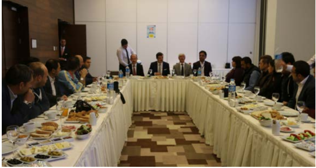
Basın mensuplarıyla yapılan VIP proje tanıtım toplantısından bir kare.

Proje süresince yürütülecek faaliyetler yoluyla öğrencisi ile birlikte daha bilinçli ve daha kaliteli zaman geçiren, öğretmenler ile sürekli iletişim halinde olan ve sadece ihtiyacı olduğu anda değil her zaman okulu ile birlikte olan veli profiline oluşturulması hedeflenmektedir.